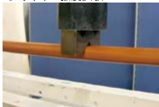
● 手すりの強度試験